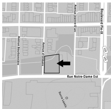
Point de rencontre et site d'interventions artistiques

www.wildcitymapping.org facebook.com/wildcitymapping